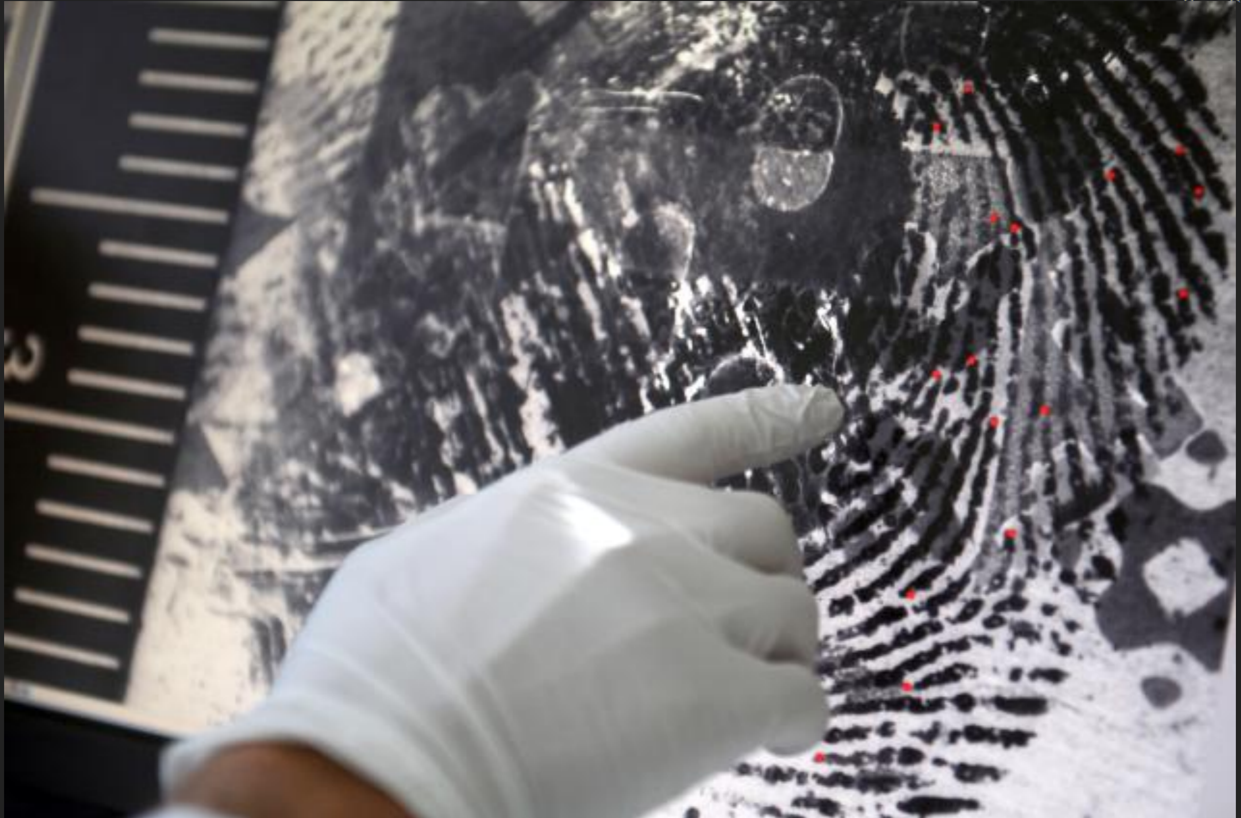
ANALISI DELLE IMPRONTE DIGITALI IN UN LABORATORIO DELLA POLIZIA